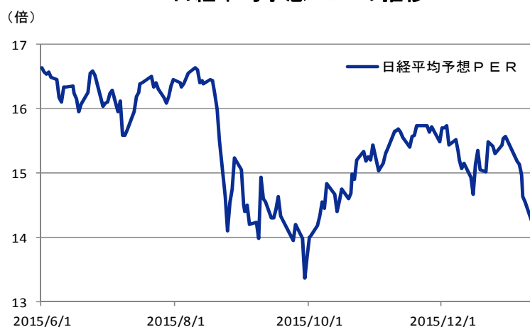
日経平均予想PERの推移

期間：2015年6月1日-2016年1月13日