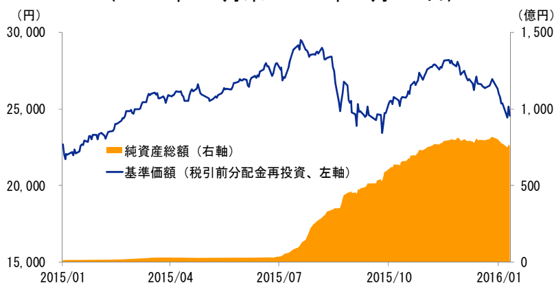
基準価額(税引前分配金再投資)と純資産総額の推移 (2014年12月末-2016年1月14日)

2016年1月14日時点の、当ファンドの基準価額(税引前分配金再投資)は24,555円、年初来騰落率は-8.87%の下落となりました。同時点の日経平均株価は17,240.95円、年初来騰落率は-9.42%の下落となりました。主要な保有銘柄においては、キーエンス(-14.6%)、ユニ・チャーム(-13.7%)、アシックス(-12.9%)などが大幅に下落する一方、テルモ(-3.0%)、良品計画(-3.1%)、シマノ(-6.9%)などは小幅な下落に留まりました(銘柄名の括弧内は同期間における騰落率(2016年1月14日時点))。